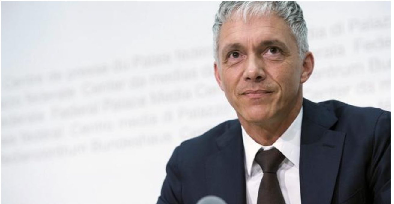
Swiss Attorney General Michael Lauber

Anda lihat, 14 Triliun Dollar AS dimasukkan sebagai deposito tunai ke dalam offshore bank, itulah yang sekarang menjadi masalah besar. Itu adalah nyata dan didepositokan, tapi FED, CIA, Swiss, dll – telah menyatakan dengan jelas kepada orang ini bahwa dana-dana ini tidak dapat digunakan.