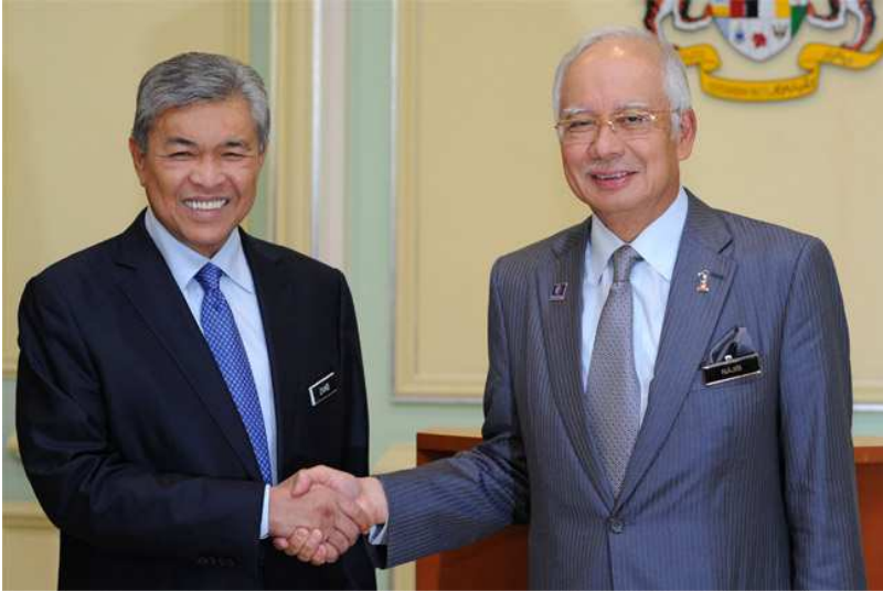
Les complices du crime : Ahmad Zahid-Hamidi et Najib Razak

Heureusement, la personne déclarée « décédée » par Razak (afin qu'il puisse lui voler ses milliards) est toujours bien vivante, comme mentionné dans notre rapport précédent sur le sujet.